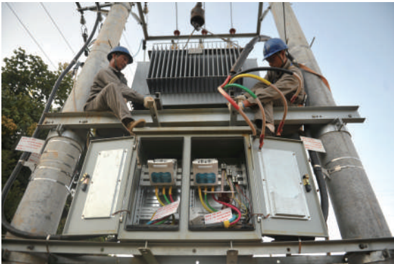
甘鲁村升级变压器