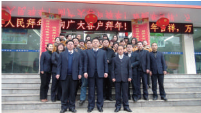
▲崇阳农商银行春节团拜