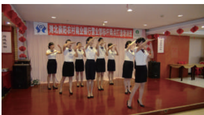
▲崇阳农商银行员工培训