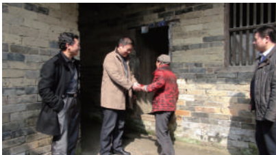
▲崇阳农商银行董事长慰问困难户