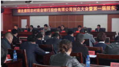
▲崇阳农商银行创立大会

崇阳农村商业银行将牢固树立“敬业、忠信、严谨、创新”的核心理念，以邓小平理论、“三个代表”重要思想和科学发展观为指导，深入贯彻落实党的十八大精神，坚持以人为本，坚持科学发展，努力建设具有鲜明时代特征和行业特色的先进企业文化，创新独特品牌，全面提高核心竞争力，将崇阳农村商业银行打造成有竞争力的、勇于担当的、敢负责任的、党政满意的、全县人民信任的一流服务县域经济主力银行。 选择农商行 共创新辉煌 携手农商银行 共建富饶崇阳