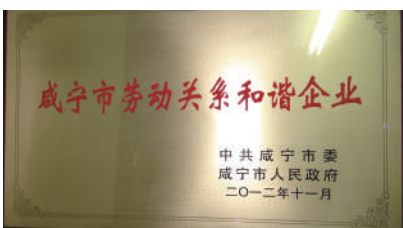
▲被评为全市劳动关系和谐企业