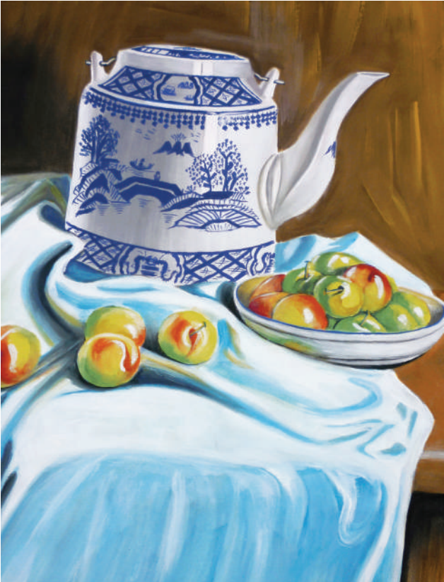
水粉画 静物 ■朱美进