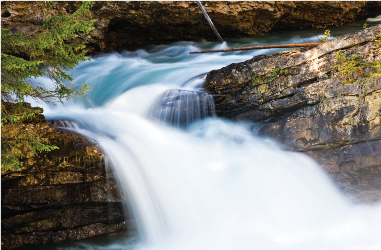
摄影 水之韵 ■朱文杰