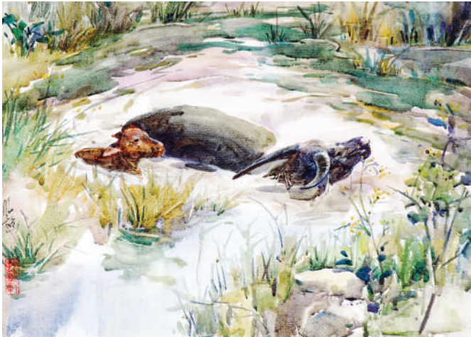
水粉画 浴 ■马凤超