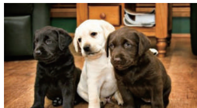
▲他们说我不是妈妈亲生的,我觉得它们在骗我。