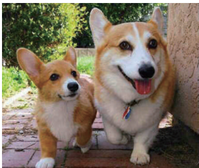
▲“你真能带我去吃好东西吗?”“恩,骗你是小狗!”