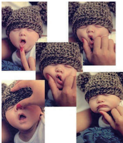
▲这个孩子他妈有点不靠谱