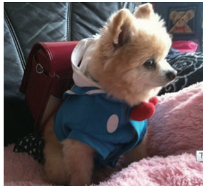
▲妈妈,今天能不能不去学校