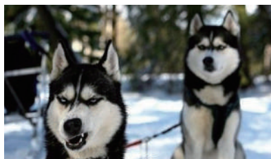
▲前面那个二货,你再装酷,一定会被人当成狼抓走的。