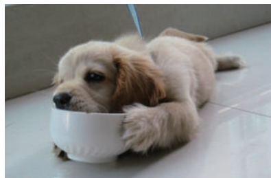
▲妈妈说不可以浪费粮食