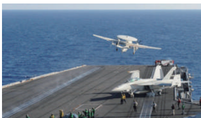
美国“尼米兹”号核动力航母战斗群在南海海域高调亮相

菲律宾近日因仁爱礁问题与中国摩擦不断,频频出小动作,企图将仁爱礁占为己有,面对中国的强硬态度,菲律宾更是叫嚣要与中国一战到底,为“守礁”战到最后一人。为了威慑菲律宾,中国海军三大舰队集聚南海,展开了多兵种立体大规模联合演习。