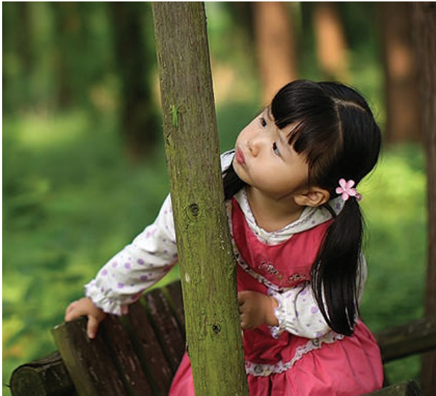
往哪儿跑