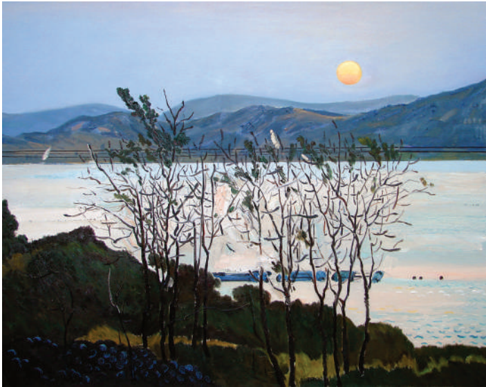
绘画 金桂湖之恋 ■徐昊