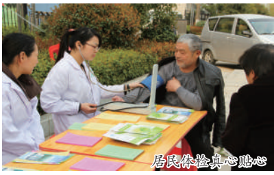
居民体检真心贴心