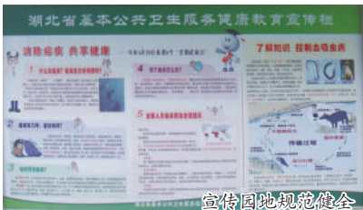
宣传园地规范健全