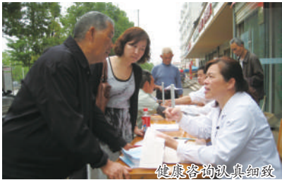
健康咨询认真细致

困难和阻力；所以，该中心全体医务人员希望各级领导继续关心、支持他们做好这项工作；社会各界人士和全体居民多多理解、包容、配合他们开展好这项工作，以进一步提高居民健康知识的知晓率、健康意识的上升率、健康水平的提高率；从而促进和推动温泉城区卫生健康、文明品位的整体提升，为创建国家卫生城市、建设鄂南强市和“五个咸安”，打造香城泉都中心城起到一定的作用。