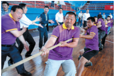
10日，咸安区第十届全民健身暨第五届农民运动会在巨宁体育馆举行，来自全区的十四个乡镇办厂100余农民参加活动。活动为期一周，比赛项目包括拔河、象棋，乒乓球，羽毛球，篮球等，活动旨在加强全民健身。

市职业技能培训机构，分别对光宝科技、南玻玻璃有限公司、奥瑞金制罐有限公司、厚福医疗装备有限公司等11家我市规模型企业开展送培训进企业活动，共有2000余名企业员工将接受安全和机械自动化、动力转向器结构与工作原理、电工等多项专业技能培训，缓解企业技能人才缺乏的问题。