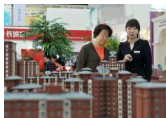
在第五届中国西部房·车博览会上,观展者正在房屋销售展区参观商品房沙盘模型。此次博览会交易总额9亿元,观展人数达38.5万人次。