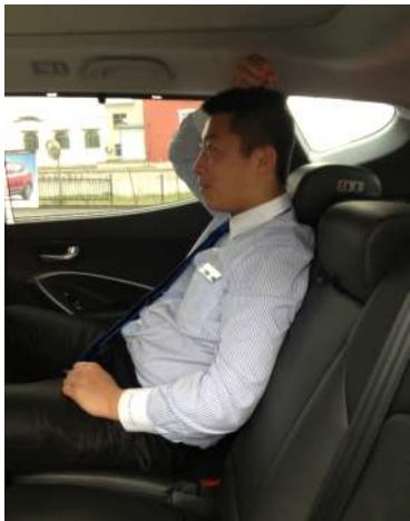
1.8米个头上方仍有富余