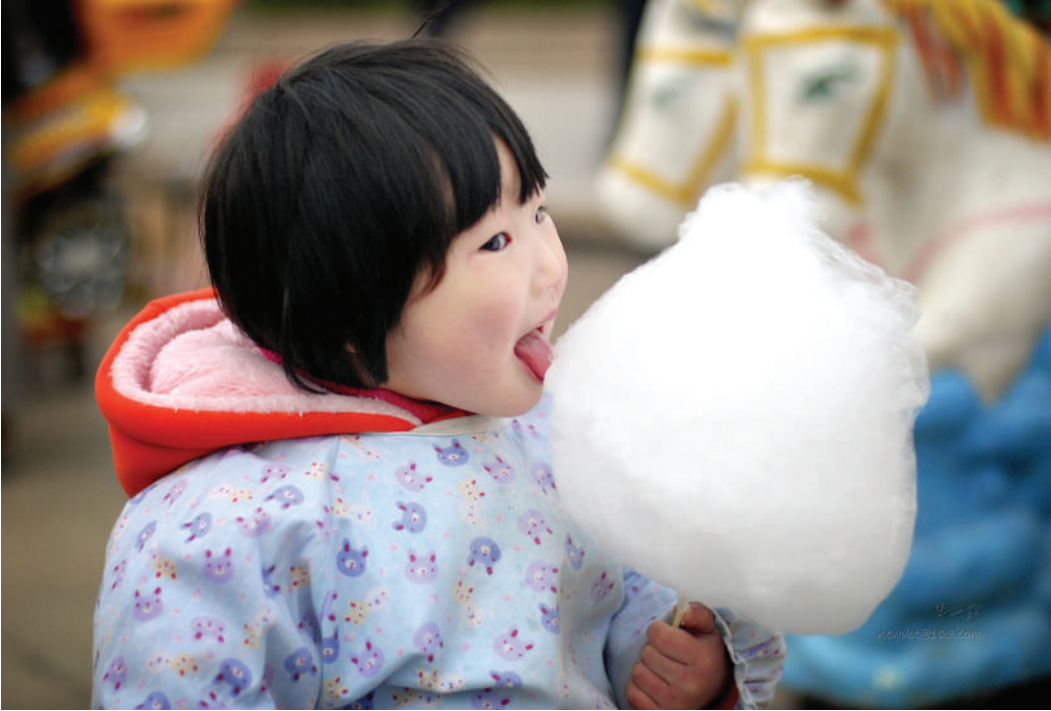
摄影 棉花糖 ■ 杨华

柴门凝结成时光深处的符号 一只狗驻守着寂寞 雨飞雪飞 柴门漫漶犬吠沧桑 生命中最暖的痕