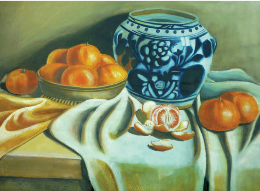
水彩画 静物 ■ 朱美进

如果可以选择 我愿飘进一池春水 化作一叶闪亮扁舟 在碧波上荡漾 那是我新的生命 新的航向