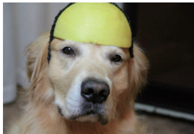
▲主人给我做的柚子帽