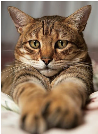
▲喵星人的忧伤有谁懂