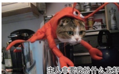
主人非要我扮什么龙虾