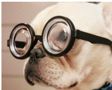
▲唉,年纪大了,要戴眼镜才能看清美女