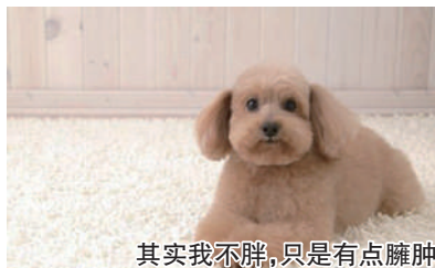
其实我不胖,只是有点臃肿