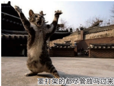
要打架的都尽管放马过来