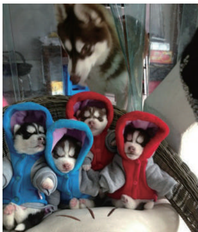
▲孩子们,睁眼啊,拍照啦!