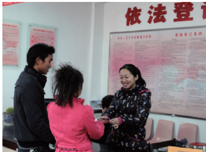
婚姻登记热情服务