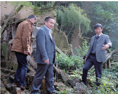
倒房重建现场察看