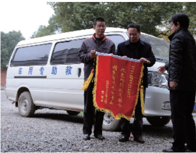
救助对象前来感谢