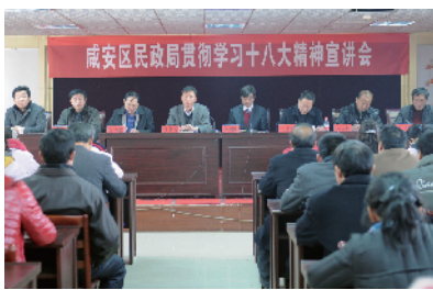
学习宣讲认真踏实

“衙斋卧听萧萧竹,疑是民间疾苦声。”清代著名书画家郑板桥先生这句千古名句准确地描述出该局全体干部职工认真履职的优良作风和乐于为民解忧的百姓情怀。2013年,该局将以科学发展为主题,以服务大局为根本,以改善民生、创新社会管理和发展公共服务为目标,紧紧围绕咸安区委、区政府的决策部署,着力提高民生保障水平,着力增强社会自治功能,着力提升民政公共服务能力,着力加强民政文化建设,为打造鄂南强市,建设“五个咸安”作出新的更大的贡献!